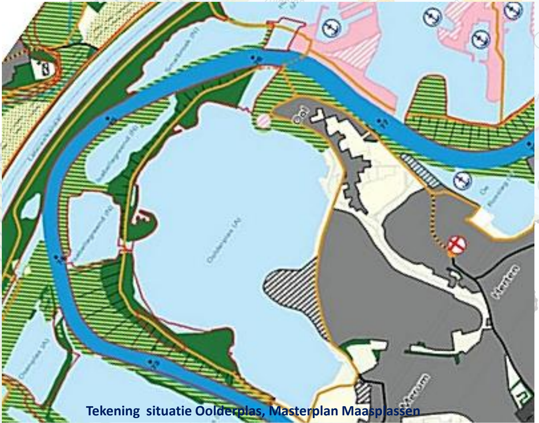
Tekening situatie Oolderplas, Masterplan Maasplassen